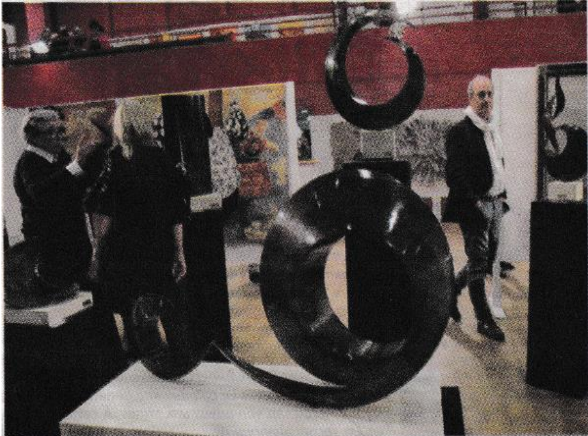
Les sculptures de Jacques Brouail à l'honneur.