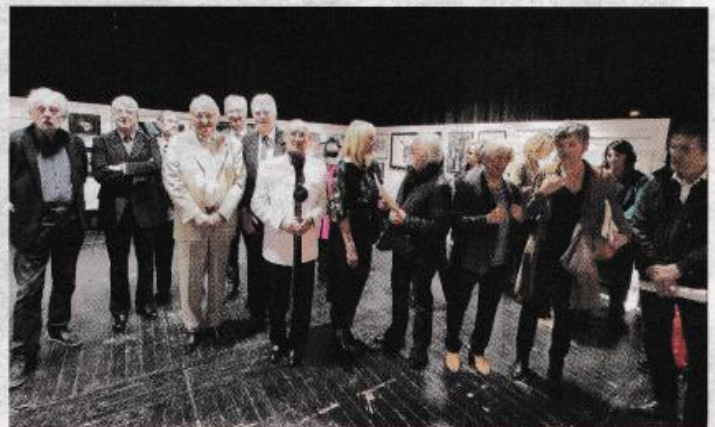
Les élus en présence des artistes.

« Je ne jette rien, j'attache, je répare avec des fils comme si je voulais attacher la réalité. C'est le cas pour le tableau l'arbre gardé », explique la peintre. Les autres prix de la Biennale sont : le prix d'honneur