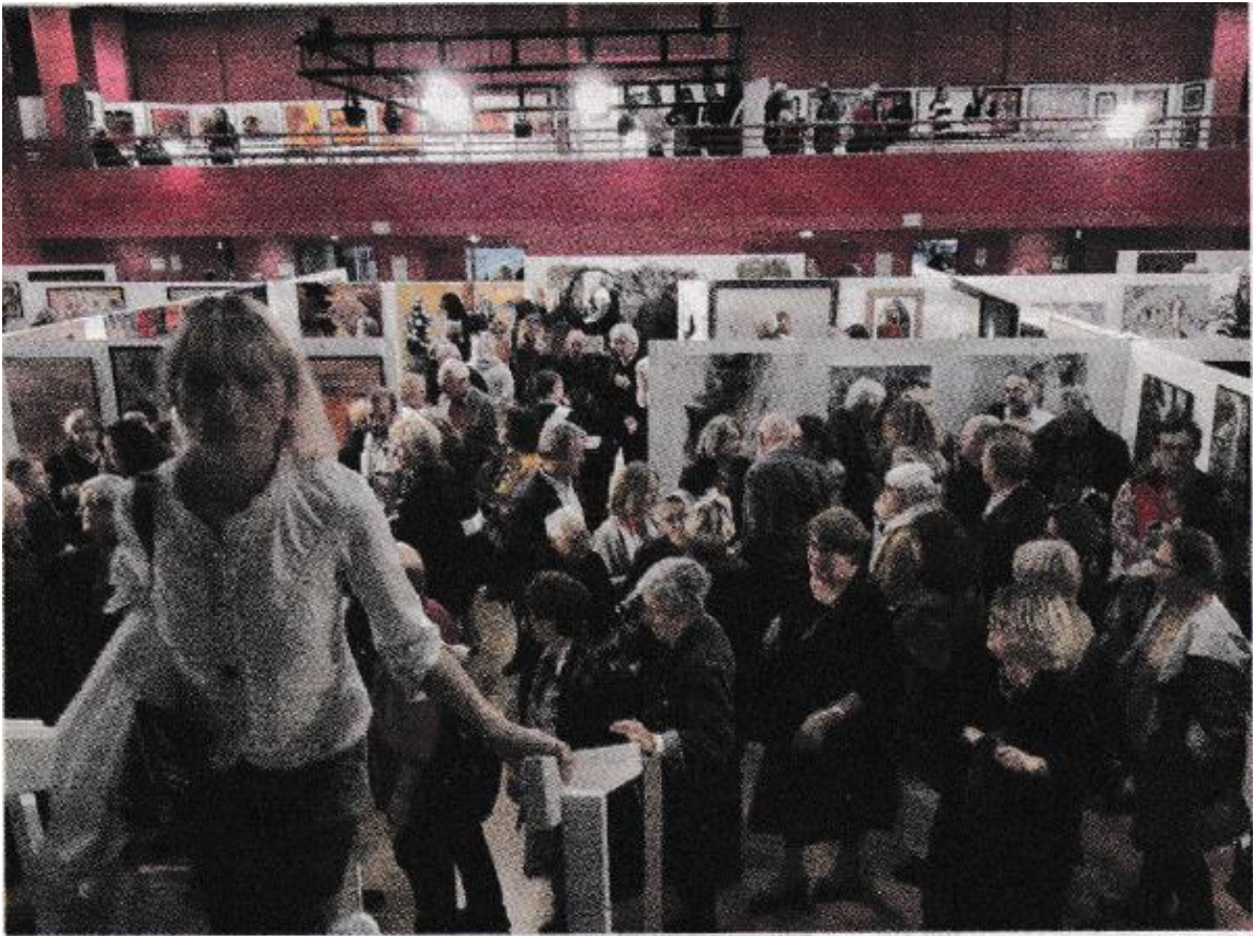
La foule était au rendez-vous lors de l'inauguration samedi à 18h.