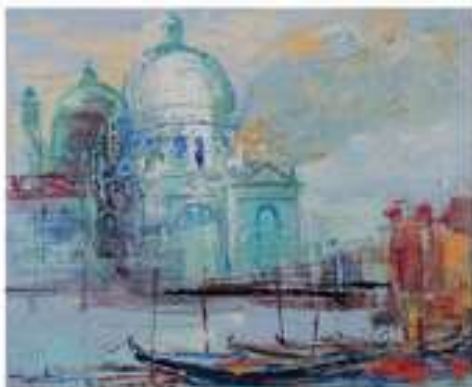
Hervé Lolier - Cathédrale devant Le Salut