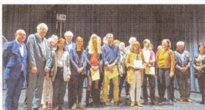
Les lauréats de la Biennale 2018.

Beaucoup de monde à l'inauguration de la 13 e Biennale de sculpture animalière qui se tiendra jusqu'au 21 octobre à la salle Patenôtre.